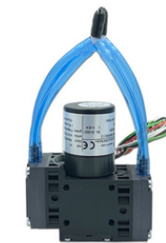
DOUBLE DIAPHRAGM cod:GEM7093