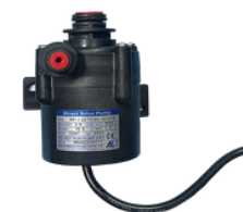
RD-12ZTV24 -Q1V14 cod:GEM7104