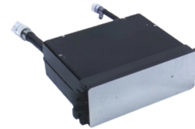
LHF SG1024 cod:GEM9653

Les têtes d'impression dans les machines numériques céramiques sont des composants de précision qui projettent des encres sur les carreaux. Fabriquées avec des matériaux durables comme la céramique, elles garantissent une impression haute résolution et gèrent de manière fiable les fluides abrasifs. Idéales pour la production céramique numérique, elles permettent d'obtenir des motifs et des couleurs nets sans colmatages fréquents.