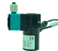
PL 8514 cod:GEM7117